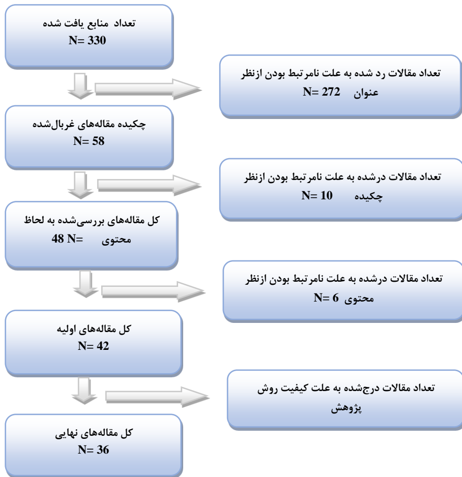
شکل (۲) فرآیند ارزیابی و انتخاب مقاله‌ها

جزئیات مقاله (نام نویسنده، سال و...) را در نظر گرفت و مقالاتی که با سؤال و هدف پژوهش تناسبی نداشت، حذف نمود. معیار پذیرش و رد مطالعات شامل ثبت پژوهش در پایگاه‌های معتبر، بازه زمانی مطالعه، شرایط مطالعه، جامعه مطالعه و نوع مطالعه بود. در نهایت ۳۶ مقاله به‌عنوان مرتبط‌ترین منابع برای استخراج پاسخ سؤال پژوهش انتخاب شدند که در شکل شماره ۲ خلاصه فرایند ارائه شده است.