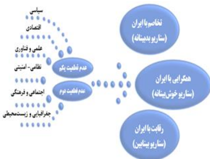
شکل شماره ۲- سناریوهای امنیتی محتمل جمهوری آذربایجان در رابطه با جمهوری اسلامی ایران

پالایش و تجزیه و تحلیل در نتایج پرسش‌نامه و رتبه‌بندی عوامل کلیدی و پیشران‌ها بر مبنای میزان اهمیت و عدم قطعیت و با توجه به نظر خبرگی تعیین شدند. دو عامل که از تأثیرگذاری و عدم قطعیت بالایی برخوردار بودند به‌عنوان دو عدم قطعیت کلیدی و عمده آینده‌ساز بین ج.ا. ایران و ج. آذربایجان انتخاب و نمودار شکل‌گیری فضاهای منجر به پیدایش سناریوهای بین دو کشور در سطح راهبردی ترسیم شد. سه سناریوی حاصل از فضاهای یاد شده با استفاده از ده عامل کلیدی و پیشران برتر احصاء و تجسم و سناریوهای امنیتی محتمل ج. آذربایجان در رابطه با ج.ا. ایران در قالب شکل زیر ترسیم گردید.