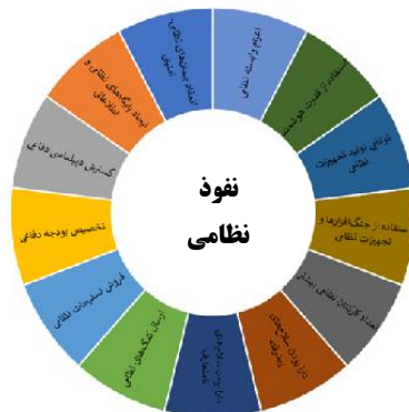
شکل (۱) الگوی پیشران‌های نفوذ نظامی جمهوری اسلامی ایران در منطقه غرب آسیا

در ادامه برای سنجش میزان ضریب نفوذ نظامی و تعیین میزان اثرگذاری و اثرپذیری این متغیرها بر یکدیگر و پس از شناسایی ۱۳ پیشران کلیدی نفوذ نظامی و با ورود آن‌ها به نرم‌افزار میک‌مک ماتریس تأثیر متقابل در ابعاد 13 \times 13 برای تعیین میزان نفوذ هر یک از پیشران‌ها، مورد تجزیه و تحلیل قرار گرفته است. نتایج خروجی را می‌توان بر اساس نقشه مختصاتی (شکل شماره ۲) تفسیر کرد: پیشران‌های ناحیه ۱ (شمال شرقی نقشه مختصاتی)، دارای تأثیر دوجوهی است که در این پژوهش شامل: تخصیص بودجه دفاعی و ایجاد پایگاه‌های نظامی و اطلاعاتی است که می‌توان از آن‌ها به‌عنوان عامل نفوذ استراتژیک نام برد. متغیرهایی که در قسمت پایین ناحیه اول قرار دارند نیز متغیرهای هدف سیستم هستند که در این پژوهش عبارت‌اند از: گسترش دیپلماسی دفاعی، استفاده از جنگ‌افزارها و تجهیزات نظامی، استفاده از قدرت هوشمند و ارسال کمک‌های نظامی، در واقع این عوامل را باید هدف سیستم (یا عامل نفوذ) تلقی کرد. همچنین پیشران‌های ناحیه دوم (شمال غربی نقشه مختصاتی) این متغیرها تحت عنوان پیشران‌های مستقل یا اثرگذار شناخته شده و بر کل سیستم اثرگذارند؛ این متغیرها شامل: سلاح‌های غیر متعارف، توانایی تولید تجهیزات نظامی و در اختیار داشتن سلاح‌ها و تجهیزات پیشرفته است. دسته سوم متغیرهای تأثیرپذیر یا وابسته هستند که در ناحیه سوم (جنوب شرقی نقشه مختصاتی) قرار دارند. در این پژوهش این متغیرها به‌عنوان وابسته نظامی و فروش تسلیحات محدود شده است و در نهایت متغیرهای خودکنترل هستند که در ناحیه چهارم (جنوب غربی نقشه) قرار دارند و