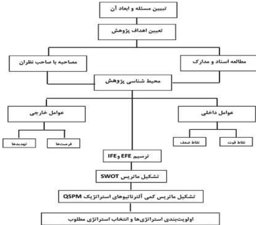
شکل (۱) مدل مفهومی پژوهش

پرسشنامه به روش محتوایی و مبتنی بر نظر خبرگان تأیید گردیده و پایائی سؤالات نیز از روش آلفای کرونباخ محاسبه شده که میزان پایایی درونی آن بالای ۰.۷ بوده است.