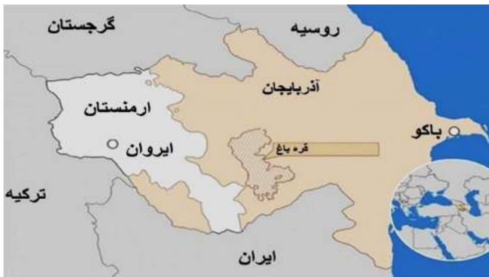
نقشه (۱): موقعیت جغرافیایی منطقه قفقاز جنوبی

ب: قفقاز شمالی یا ماورای قفقاز شامل جمهوری‌های خودمختار تحت حاکمیت فدراسیون روسیه به ترتیب از شرق به غرب؛ داغستان، چچن، اینگوش اوستیای، شمالی کارباردا - بالکار قاراچای، چرکس و آدیگه (افشردی، ۱۳۸۱: ۳۷).