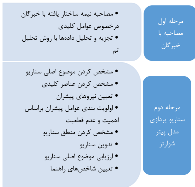
نمودار (۱) نقشه راه پژوهش

در این پژوهش محقق به منظور تکمیل پژوهش‌های گذشته بدنبال بررسی هر دو گروه عوامل برون و درون سازمانی از طریق مراجعه به آرا خبرگان است تا سناریوهایی با قابلیت کاربرد در دنیای واقعی برای سازمان تامین اجتماعی ارائه نماید. از جمله نوآوری‌های این پژوهش می‌توان به دستیابی به عوامل کلیدی، پیشران و عدم قطعیت‌های بحرانی سازمان تامین اجتماعی ایران اشاره نمود که می‌توانند در ترسیم آینده سازمان تامین اجتماعی از طریق تدوین سناریوی مطلوب تاثیر بسزایی داشته باشند.