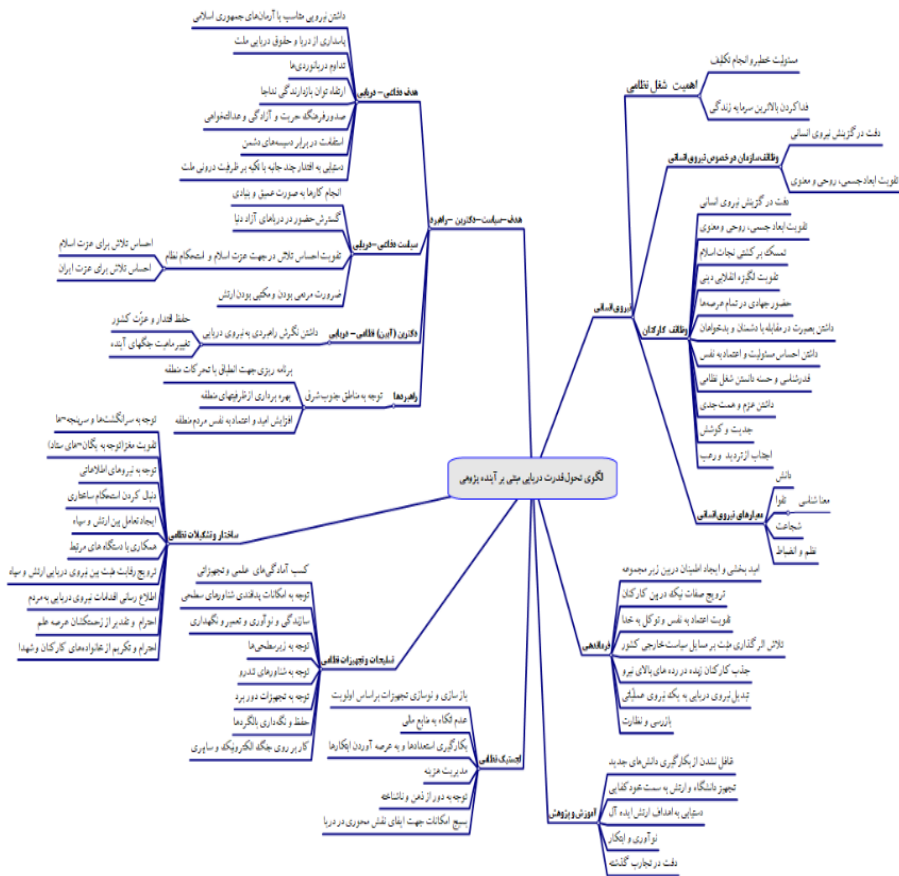
شکل (۱) محوربندی بیانات فرماندهی معظم کل قوا در خصوص تحول قدرت دریایی مبتنی بر آینده