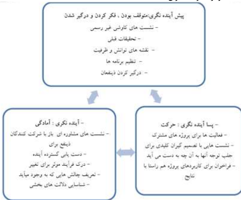
شکل (۱) چگونگی و ترتیب اجرای فرآیند آینده‌نگاری

پژوهش دیگری، فرآیند آینده‌نگاری فوق را در چارچوب پیشنهادی که از سه بخش بافتار داخلی، خارجی، فرایند آینده‌نگاری و زنجیره ارزش تشکیل شده است، برابر شکل زیر ارائه می‌نماید (محمودزاده و همکاران، ۱۳۹۶):