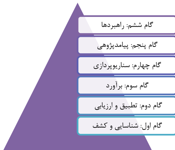
شکل (۳) چارچوب ارائه شده برای مطالعه شگفتی‌سازهای نظامی - دفاعی

پس از توصیف سناریوهای شگفتی‌ساز، به کمک چرخ آینده می‌توانیم لایه‌های عمیق‌تر روابط علی- معلولی را کشف و مورد بحث و بررسی قرار دهیم. این کار کمک خواهد کرد تا پیامدهای احتمالی هر شگفتی‌ساز دقیق‌تر و جامع‌تر مورد ارزیابی و تجزیه و تحلیل قرار گیرد. چرخ آینده را در قالب جلسات ذهن‌انگیزی و پنل‌های خبرگی یا مهمتر از آنها در کارگاه‌های آینده‌پژوهی می‌توان با حضور نیروهای نظامی و خبره‌های غیرنظامی پیاده کرد. چرخ آینده یکی از ساده‌ترین و کارآمدترین روش‌ها برای توسعه فضای داستانی هر سناریو است. از این روی حتی در دقیق‌تر کردن برآوردهای ارائه شده در گام سوم هم می‌تواند موثر باشد و شگفتی مورد بحث را بیشتر معرفی کند. چرخ آینده به عنوان روشی کارآمد در کشف لایه‌های پنهان تغییر، آشکار سازی لایه‌ها، توصیف سناریوهای جدیدتر و بسط پیامدها در حوزه‌های مختلف، در قالب پنل‌های خبرگی، جلسات ذهن‌انگیزی و حتی مصاحبه‌های عمیق قابل پیاده کردن در این گام است.